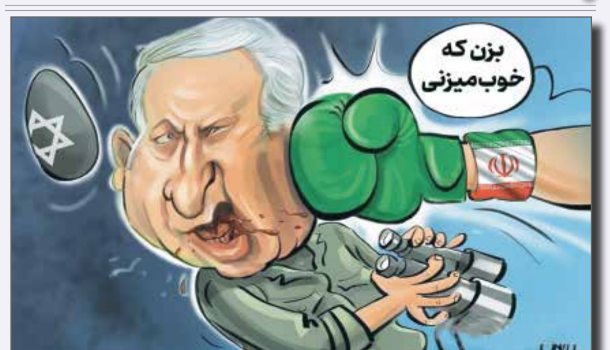
همه مردم ایران مشتت بر دهان اسراییل شده اند