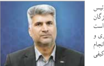
دو سال در سمت خود به عنوان رئیس