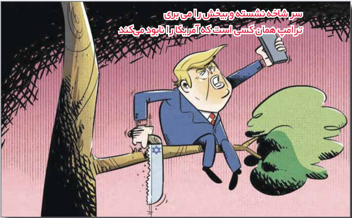
سر شاخه فلسطین و بیخش را می بری ترا می پ همان کسی است که آمریکار را نابود می کند