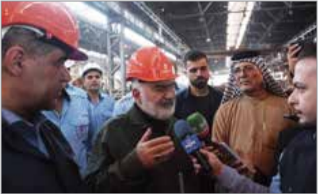
استاندار خوزستان با مدیران واحدهای تولیدی در خط تولید فولاد مبارک

واحد‌های تولیدی تأکید فراوان دارند. وی افزود: مشکل دوم در این واحد تولیدی، کمبود نقدینگی است. اگر این دو عنصر کلیدی یعنی مواد اولیه و نقدینگی تأمین هم تأمین نیاز داخلی و هم صادرات برای ارژآوری کشور است. این مسیر با وجود تمام فشارهای دشمن، به لطف الهی و با همت کارگران خوزستانی ادامه خواهد یافت.استاندار خوزستان با اشاره به فعالیت شرکت لوله‌سازی اهواز با تنها ۵۰ درصد ظرفیت به دلیل اختلال در تأمین مواد اولیه، تأمین نقدینگی و بازسازی زنجیره تولید درون‌استانی را دو اولویت اصلی برای تثبیت اشتغال و مقابله با جنگ اقتصادی دشمن اعلام کرد.او در حاشیه بازدید از شرکت لوله‌سازی اهواز گفت: در حال حاضر این کارخانه با ۵۰ درصد ظرفیت فعالیت می‌کند که علت اصلی آن، عدم رسیدن مواد اولیه به میزان مورد نیاز پس از بمباران‌های اخیر است. اختلال ایجاد شده در کارخانه‌های بالادستی بر اثر حملات دشمن، تأمین نیز بر ثبات شغلی و نیروی انسانی در