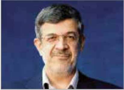
علیرضا حائری زاده سرویس استان ها // استاندار

یزد، ضمن تشریح دستاوردهای اخیر استان، از رویکرد مدیریت ارشد برای صیانت از حقوق کارگران و ارتقای زیرساخت‌های آموزشی گفت: موفقیت‌های فعلی، نه حاصل کار انفرادی، بلکه نتیجه یک هم‌فرازی جمعی در سایه وفای است.