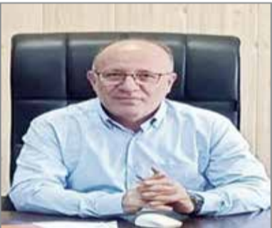
تلاش صادقانه کارگران، ستون اصلی پیشرفت و شکوفایی هر سرزمینی است و بدون شک نقش بی‌بدیل کارگران

در توسعه و اعتلای صنعت ارتباطات، شایسته بهترین تکمیل‌هاست. امروزه شرکت مخابرات به پیشروانه زحمات این عزیزان، با توسعه زیرساخت‌های شبکه و ارائه خدمات نوین ارتباطی به منازل و کسب و کارها، سازمان‌ها، صنایع و... توانسته است برای تحقق اهداف کلان خود، گام‌هایی بلند در مسیر تحول اقتصاد دیجیتال بردارد. اینجانب ضمن تبریک صمیمانه فرا رسیدن روز جهانی کار و کارگر، مراتب سپاس و قدردانی خود را از زحمات بی‌وقفه و تلاش‌های ارزشمنند شما همکاران گرامی، برای برنامه‌ها و رسیدن به اهداف تعیین شده در راستای اجرای پروژه توسعه فیبر نوری مخابرات اعلام می‌دارم و آرزوی سلامتی و تندرستی در جهت خدمت رسانی هر چه بیشتر به شهروندان از خداوند متعال خواهانم.