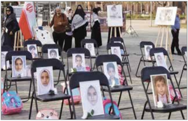
تأکید نهاد کتابخانه‌های عمومی کشور بر

کساورزی گفت: خوشبختانه اتمام و همچنین توجه لازم در جبران خسارت‌های جنگ رمضان به خوبی در استان هرمزگان دیده می‌شود و امید است خیلی زود شاهد اخبار خوشایندی برای جامعه شیلاتی استان به ویژه صیادان دریا باشیم. وی با تأکید بر اهمیت حمایت از جامعه صیادی افزود: برنامه‌ریزی برای جبران خسارات، حمایت از تعاونی‌های صیادی و ارتقای توان اقتصادی صیادان از جمله موضوعاتی است که در دستور کار سازمان شیلات ایران قرار دارد.در ادامه معاون توسعه مدیریت و منابع استناداری هرمزگان ضمن تشکر از فعالیت‌ها و پویایی شیلات در طول