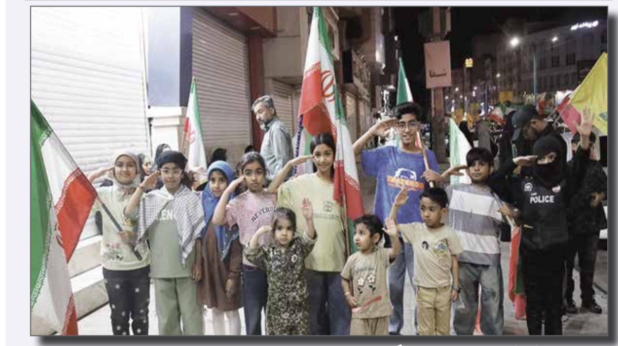
احترام نظامی کودکان و نوجوانان در سنگر خیابان