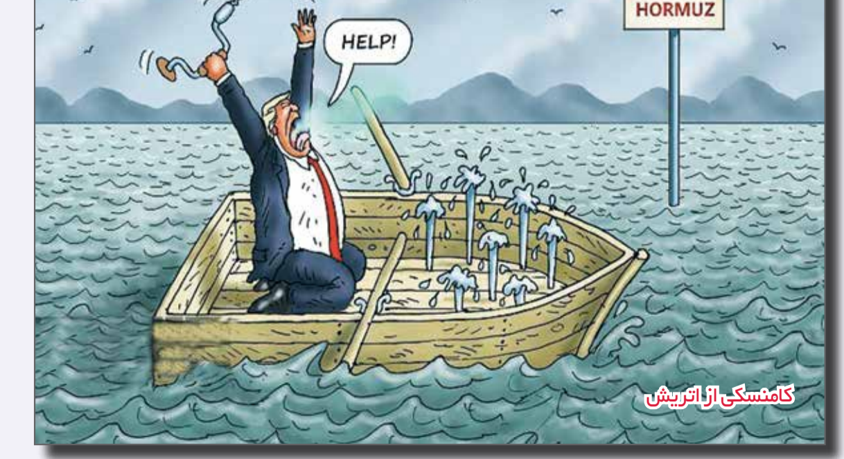
کامنسکی از اتریش