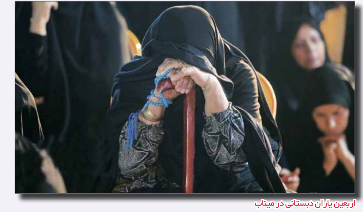
اربعین یاران دبستانی در میناب