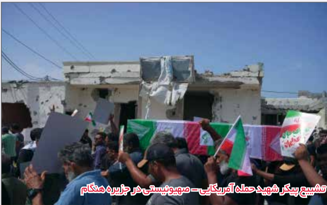
تشییع پیکر شهید حمله آمریکایی - صهیونیستی در جزیره هنگکام