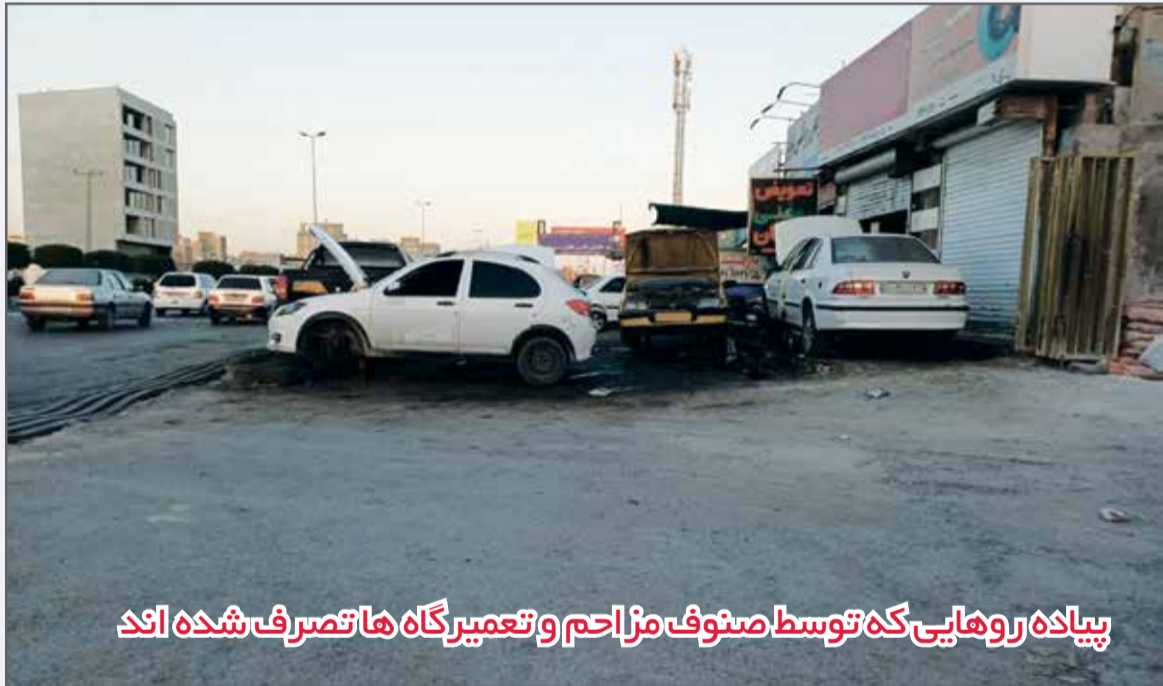
پیدا به روهایی که توسط صنوف مزاحم و تعمیرگاه ها تصرف شده اند