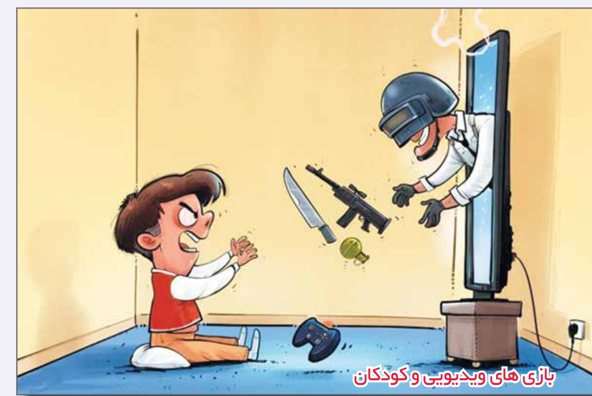
بازی های ویدیویی و کودکان