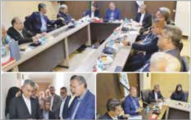
گروه سلامت // با حضور احمد مرادی نماینده مردم هرمزگان در مجلس شورای اسلامی، مرکز فیزیوتراپی