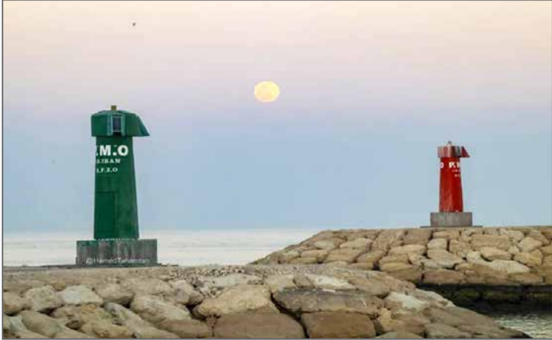
طلوع ماه در غروب خورشید - جزیره کیش