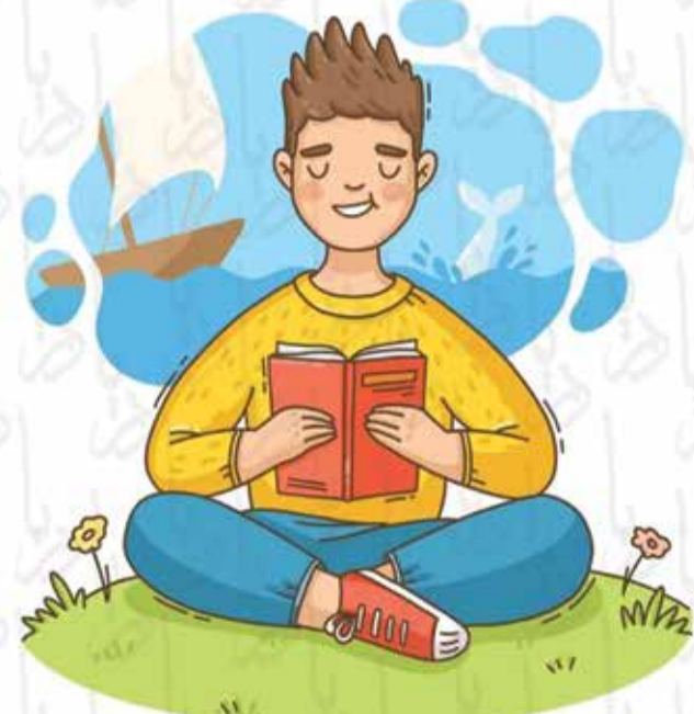
گروه مطهری، دریا