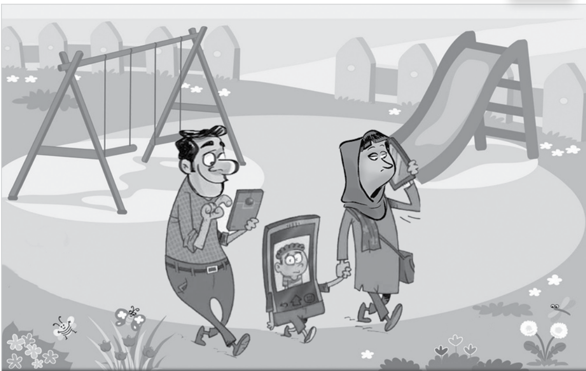
طرح: معصومه زارعی