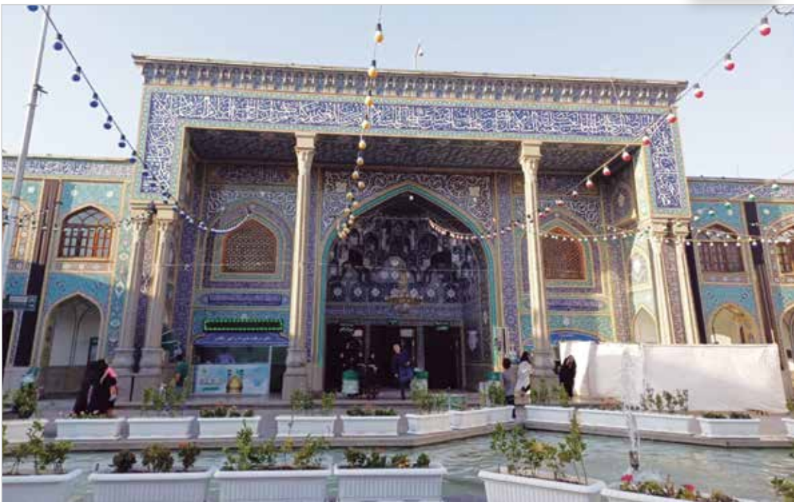
حرم مطهر شاه عبدالعظیم حسنی(ع)، شهر ری خرداد ۱۴۰۳