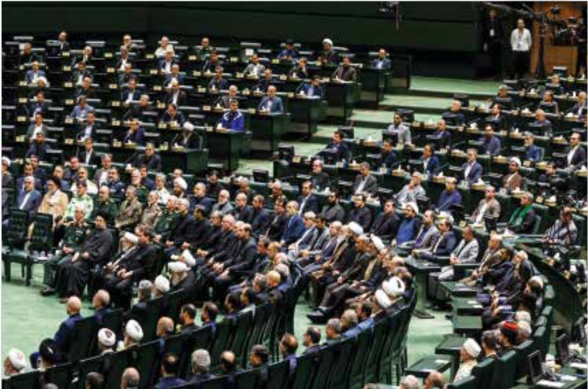
افتتاحیه مجلس دوازدهم