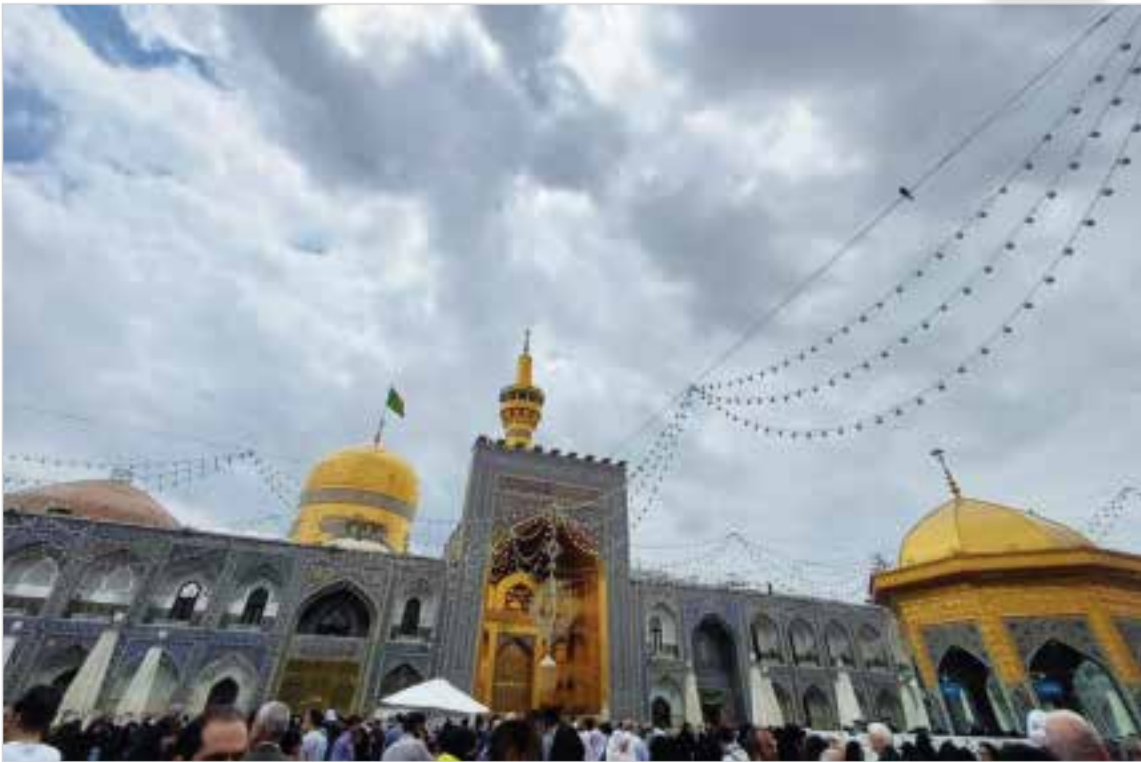
حرم مطهر امام رضا (ع) خرداد۱۴۰۳