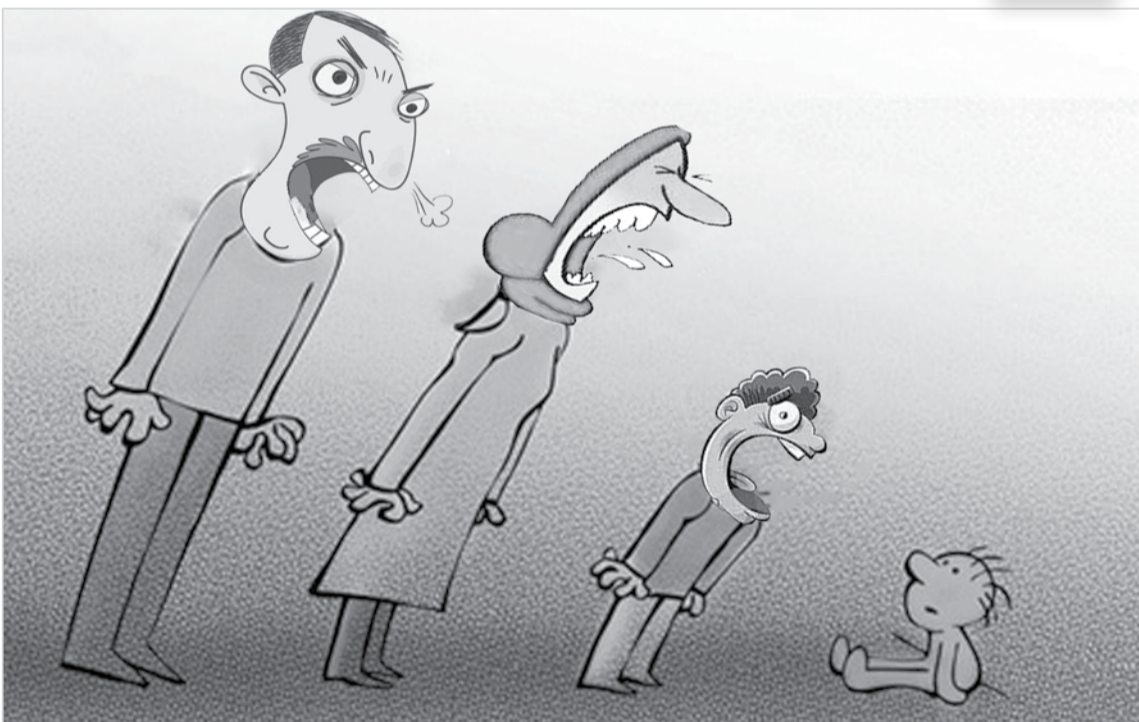
طرح: معصومه زارعی