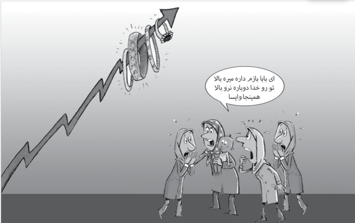
طرح: معصومه زارعی