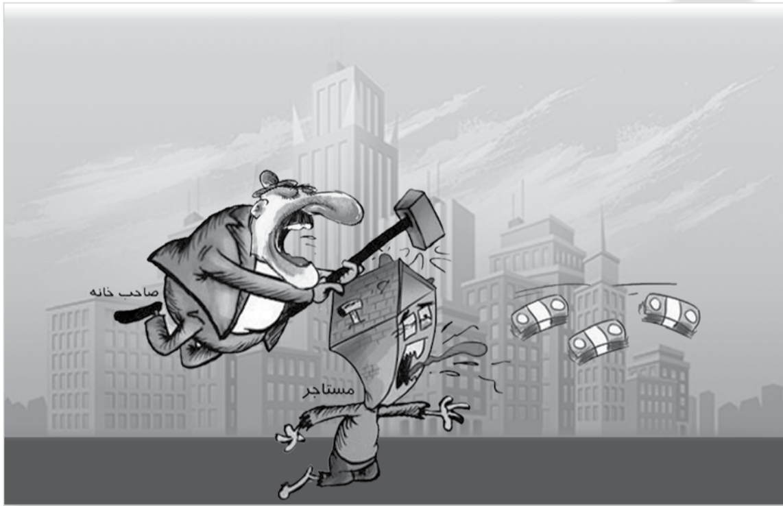
طرح: معصومه زارعی