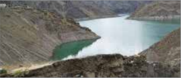
در نهایت عمران و آبادانی منطقه است.