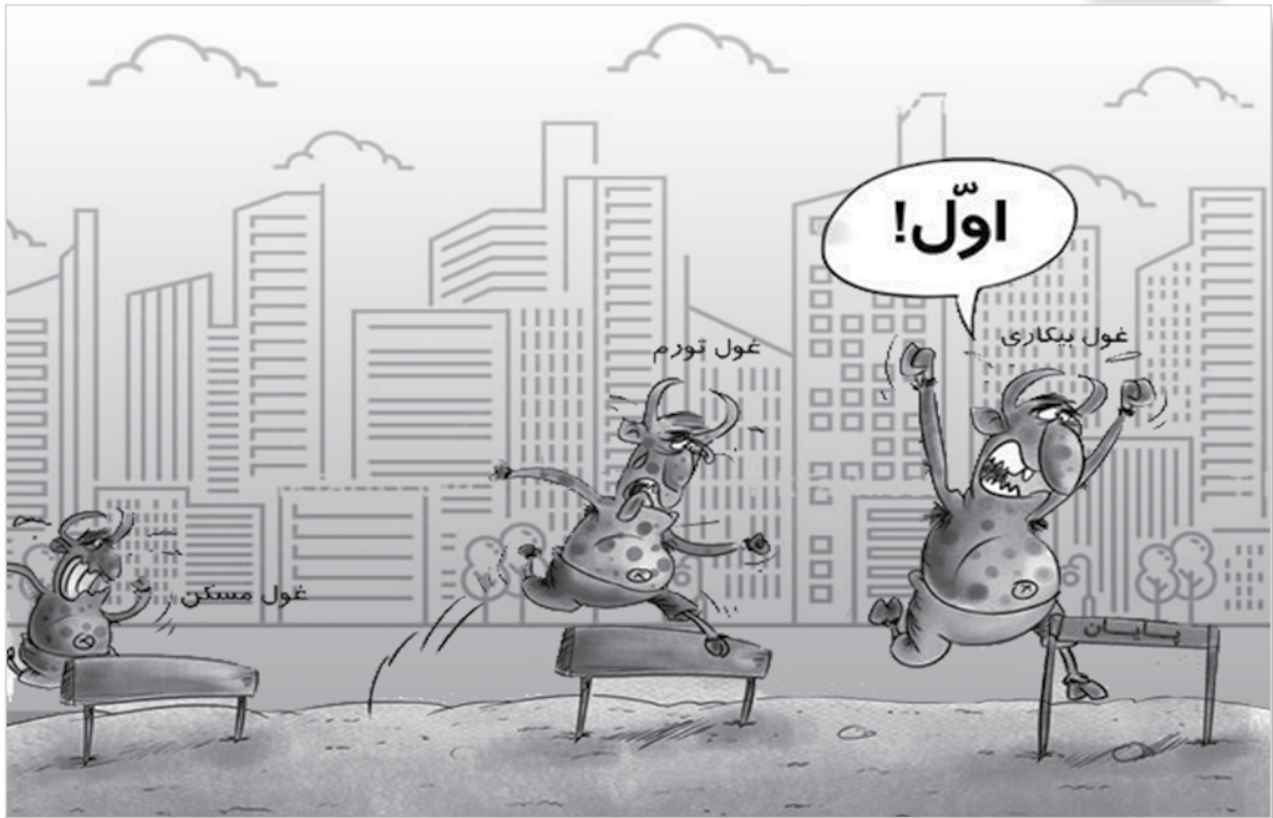
طرح: معصومه زارعی