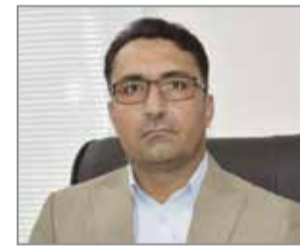
ادامه از تیتر یک // رئیس کل دادگستری استان هرمرزگان همچنین با اشاره به اینکه هیچ یک از این متهمین، راننده و فعال حوزه حمل

و نقل نمی باشند، یادآور شد: این افراد بدون هیچگونه ارتباطی با حوزه حمل و نقل قصد داشتند با تحریکات خود و بنابر ادعای که خودشان دارند تحت تأثیر تبلیغات شبکه های معاند نسبت به ایجاد اخلاص در فعالیت رانندگان شریف اقدام کنند. مجتبی قهرمانی تاکید کرد: پرونده این افراد در خصوص ارتباط با سرویس های معاند و جاسوسی همچنان مفتوح است و اتهامات آنها در دست بررسی می باشد که احکام آن متعاقباً اطلاع رسانی خواهد شد. وی با بیان اینکه متهمان متواری این پرونده نیز تحت تعقیب هستند، بیان داشت: اقدامات نظام اقتصادی «میرا» شده اند، زیرا با مراجع قضایی، انتظامی و امنیتی برای دستگیری تمامی عوامل ناامن کننده جاده های کشور ادامه دارد و مرتکبین چنین جرایمی با برخورد قاطع و بدون اغماض دستگاه قضایی مواجه خواهند شد. رئیس کل دادگستری هرمرزگان در پایان با تاکید بر اینکه رسیدگی به رانندگان شریف به فراخوان ضد انقلاب و طبق آمار، حدود ۱۱ درصد هم صدور بازنامه های حمل و نقل افزایش داشته از اتهام های سنگین تری از جمله