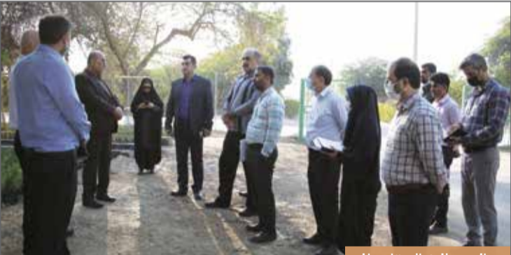
بازدید از نهالستان باغو