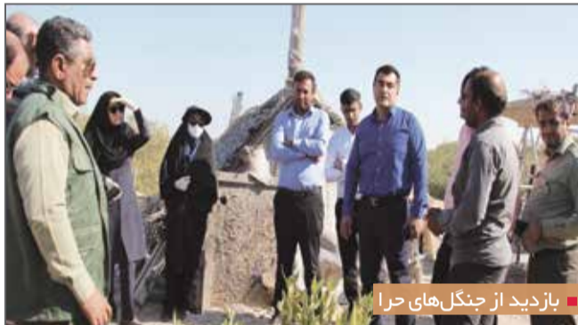
بازدید از جنگل‌های حرا