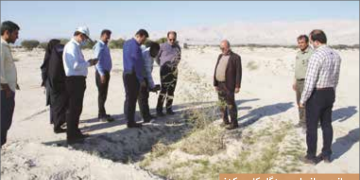
بازدید از طرح جنگل‌کاری گتخ