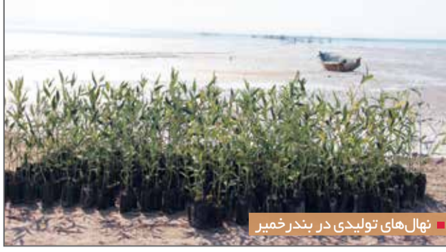
نهال‌های تولیدی در بندر خمیر