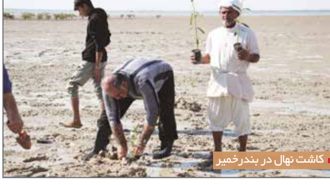
کاشت نهال در بندر خمیر