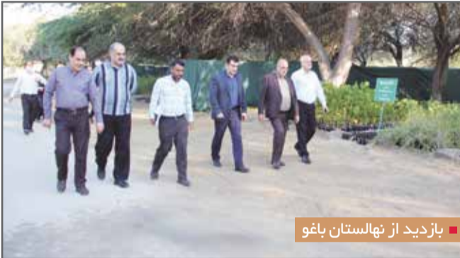
بازدید از نهالستان باغو

استان هرمزگان نیز در این مراسم گفت: بر اساس آخرین مطالعات که در سطح کشور انجام شده است، از حیث برکنش و میزان جنگل‌های مانگرو در سطح کشور که حدود ۲۰ هزار هکتار می‌باشد، ماهیان و میگو افزایش دارد. وی گفت: در سواحل