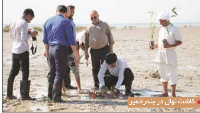
کاشت نهال در بندر خمیر