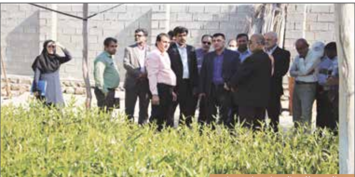
بازدید از نهالستان چاه صحرایی