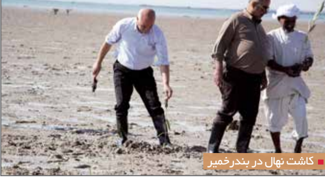
کاشت نهال در بندر خمیر