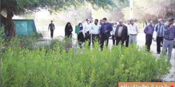
بازدید از نهالستان باغو