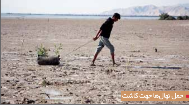
حمل نهال‌ها جهت کاشت