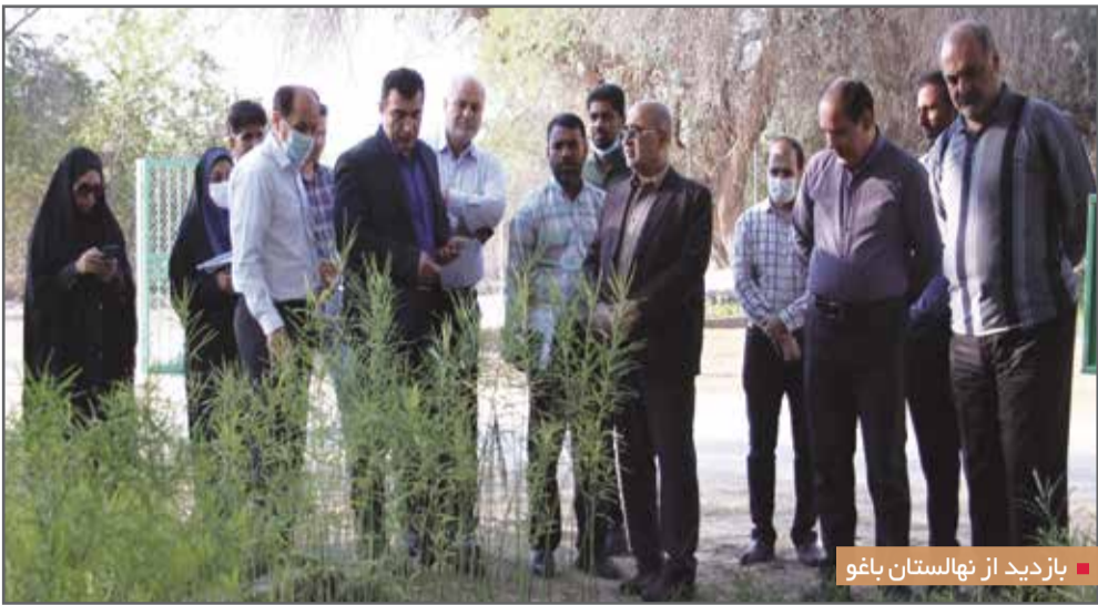
بازدید از نهالستان باغو

پنجشنبه ۱ دی ۱۴۰۱ ۲۷ جمادی الاول ۱۴۴۴ سال بیست و دوم شماره ۴۰۶۰