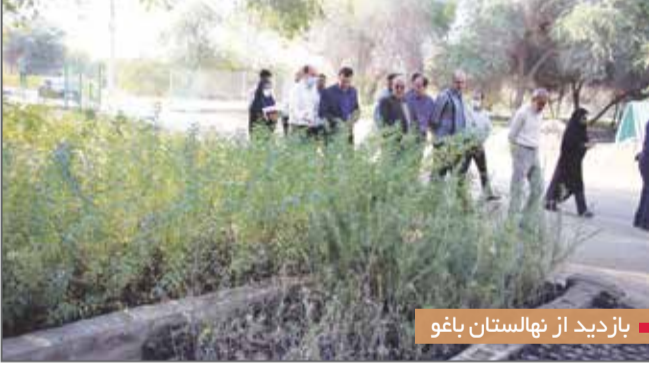
بازدید از نهالستان باغو