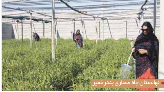
نهالستان چاه صحرایی بندر خمیر