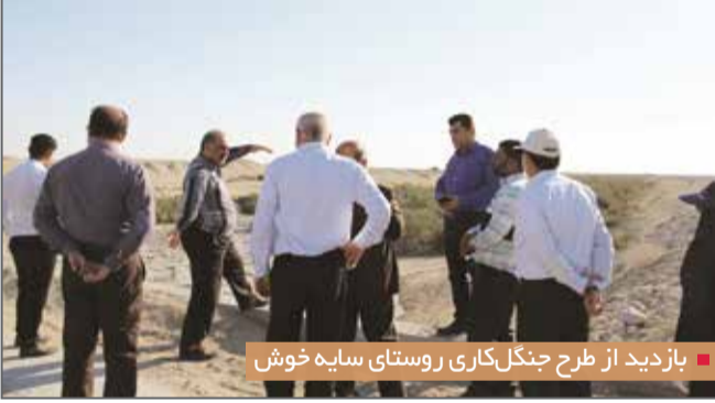
بازدید از طرح جنگل‌کاری روستای سایه خوش

تائیل موجود در منطقه می‌توان پیشرفت بهتری کردی در پایان گفت: در حال حاضر نهالستان چاه‌صحرایی اشتغال برای ۵۰ نفر ایجاد کرده است و امیداریم در آینده اشتغال بیشتری از محل نهالستان‌ها و جنگل‌کاری‌ها ایجاد شود.