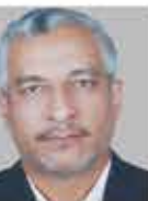
علی رازعی/ دریا