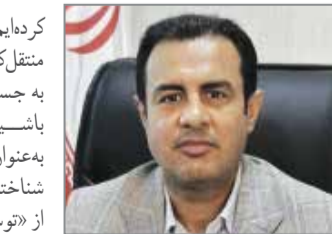
اسماعیل موحدی نژاد

کرده ایم هم زمان که شستونده، بیننده و منتقل کننده ایم، در دل شهر و مردمانش، به جستجوی آوازه ی توسعه باشیم. استانی که بر اساس شعارها به عنوان اقتصادی ترین استان کشور شناخته می شود تا به امروز چه مفهومی از «توسعه» را شناخته، با چالش های آن چگونه مواجه شده و بعد از ۴۰۰ سال برای آینده خود چه برنامه ای در سر می بروراند؟ نمونه ی موردی ما در این کاوش شهر بندرعباس است. شهری که شهریت خود را مدیون قرار گرفتن در بهترین نقطه جغرافیایی خلیج فارس می داند و از این رهگذر، سرسلسله دار تجارت دریای در دنیای قدیم و ایران کنونی است. این شهر چگونه ساخته شده و در این ۴۰۰ سال چطور توانسته میراثش - از زمین و جاده ی ترانزیتی گرفته تا دریا و صنعتگرانش - را حفظ کند و افزایش ببخشد؟ آیا این مسیر، با توجه به مولفه های توسعه در بندرعباس، سرعت مطلوبی داشته یا خیر؟ بر این اساس بندرعباس را می توان یک «شهر-دریا» نامست، شهری که شهریت خود را مدیون دریاست و از سوی دیگر،