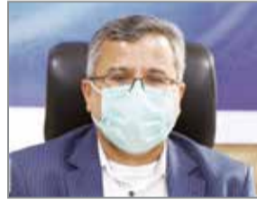
گروه خبر // مدیرکل ستاد اجرایی فرمان امام (ره) هرمزگان گفت: اولین رزمایش مواسات و همدلی در سال

به گزارش خبرنگار دریا، محسن بختیار در این بازدید با بیان اینکه دریا یک ظرفیت ویژه برای هرمزگان در تامین آب مورد نیاز مردم است، افزود: از آنجا که سیاست وزارت نیرو توسعه آبخیرینکن هاست و هرمزگان به دلیل همجواری با دریا این ظرفیت را در اختیار دارد باید پیشنهادات خود را برای توسعه آبخیرینکن ها ارائه دهد تا تامین آب مورد نیاز آنها از این محل صورت گیرد. وی با اشاره به آبخیرینکن یکصد هزار متر مکعبی بندرعباس و دیگر آبخیرینکن های با مقیاس کوچکتر، گفت: هرمزگان در گذشته همیشه دغدغه آب را داشت که با وارد مدار شدن ظرفیت های جدید آبخیرینکن بویژه یکصد هزار متر مکعبی بخش زیادی از مشکلات آبی را مرتفع کرد. معاون برنامه ریزی و اقتصادی وزیر نیرو همچنین جمعیت سازی آبخیرینکن ها را مورد اشاره قرار داد.